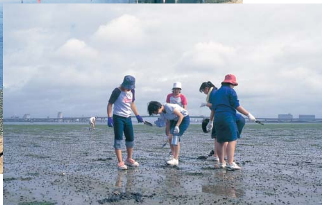
ひがた かんさつ 干潟の観察

しおかわ ひがた わた 汐川干潟(東三河の水マップをみてね。)は渡り鳥で有名ですが、水 をきれいにする役割からも大切な環境です。