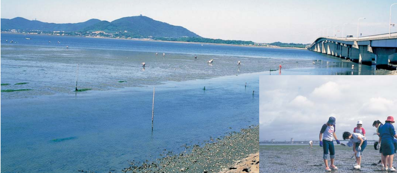
しおかわ ひがた ざおうさん 汐川干潟と蔵王山