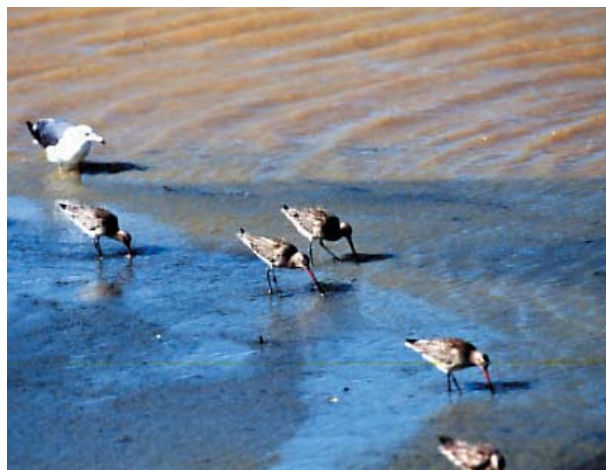
オオソリハシシギ

ひがた おとず さらに、干潟を訪れる魚や鳥たちが これらの生き物を食べることで、栄養 ぶん よご ひがた 分(汚れ)は干潟の外へ運び出され ます。このように干潟は、下水処理場 じょうか (浄化センター)と同じように水をきれ いはたら いにする働きをしています。自然の かってすごいですね。