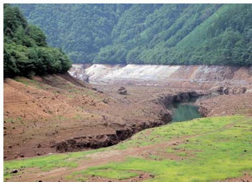
水の少なくなった宇連ダム 2001年(平成13年)8月