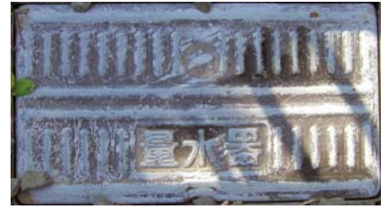
この中に水道メーターと水道を止めるバルブがあります。

わたしたちの家には、水道メーターが あります。おうちの方に、どこにあるか聞いてみましょう。水道メーターの場所がわか りましたら、1日分の使用量をはかりましょう。