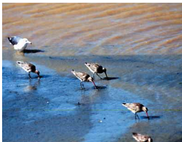
オオソリハシシギ

ひがた おとず さらに、干潟を訪れる魚や鳥たちが これらの生き物を食べることで、栄養 分(汚れ)は干潟の外へ運び出され ます。このように干潟は、下水処理場 じょうか (浄化センター)と同じように水をきれ いはたら いにする働きをしています。自然の かってすごいですね。