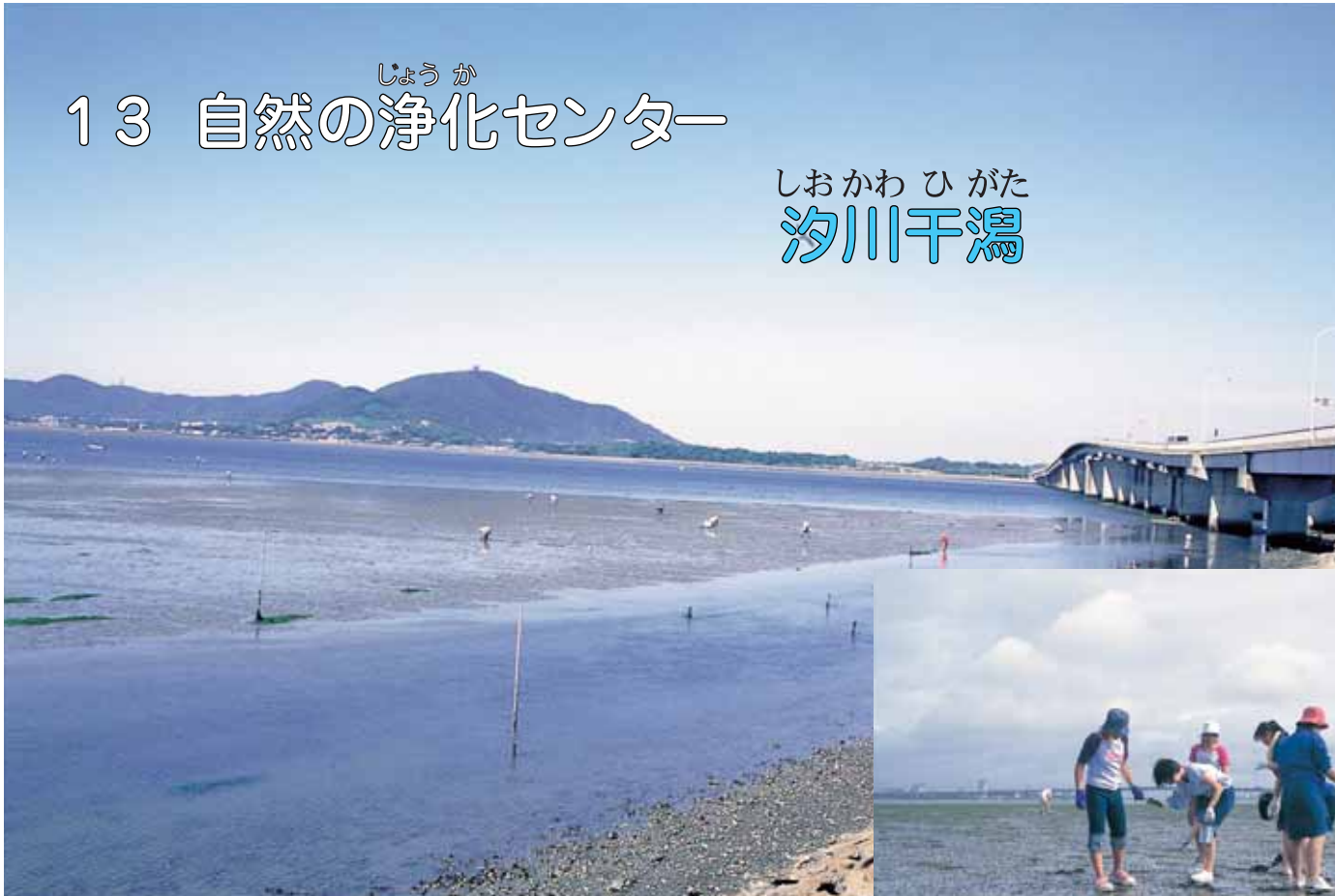
しおかわ ひがた ざおうさん 汐川干潟と蔵王山