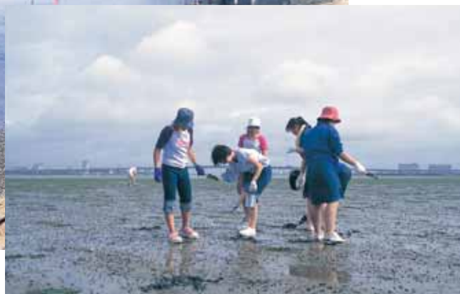
ひがた かんさつ 干潟の観察

しおかわ ひがた わた 汐川干潟(東三河の水マップをみてね。)は渡り鳥で有名ですが、水 をきれいにする役割からも大切な環境です。