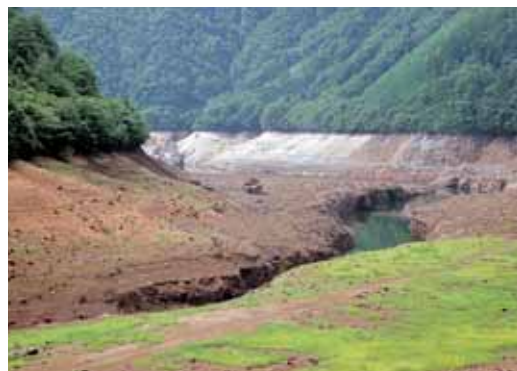
水の少なくなった宇連ダム 2001年(平成13年)8月