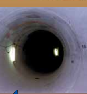
橋良雨水幹線 直径2.4m

下水道管は、水がちゃんと流れるようにななめに埋められているんだ。まるですべり台みたいだね。