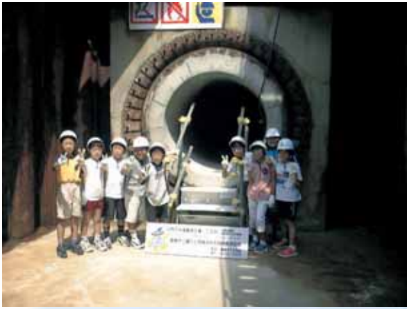
うめだ だい おすい かんせん 梅田第2汚水幹線(大山町)見学会 2000年(平成12年)7月