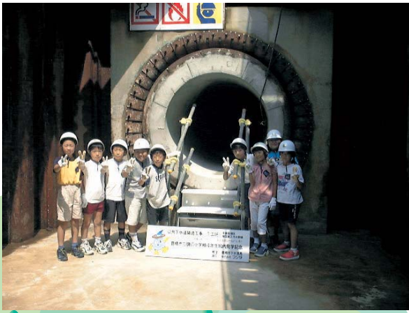
うめだだい おすい かんせん 梅田第2汚水幹線(大山町)見学会 2000年(平成12年)7月