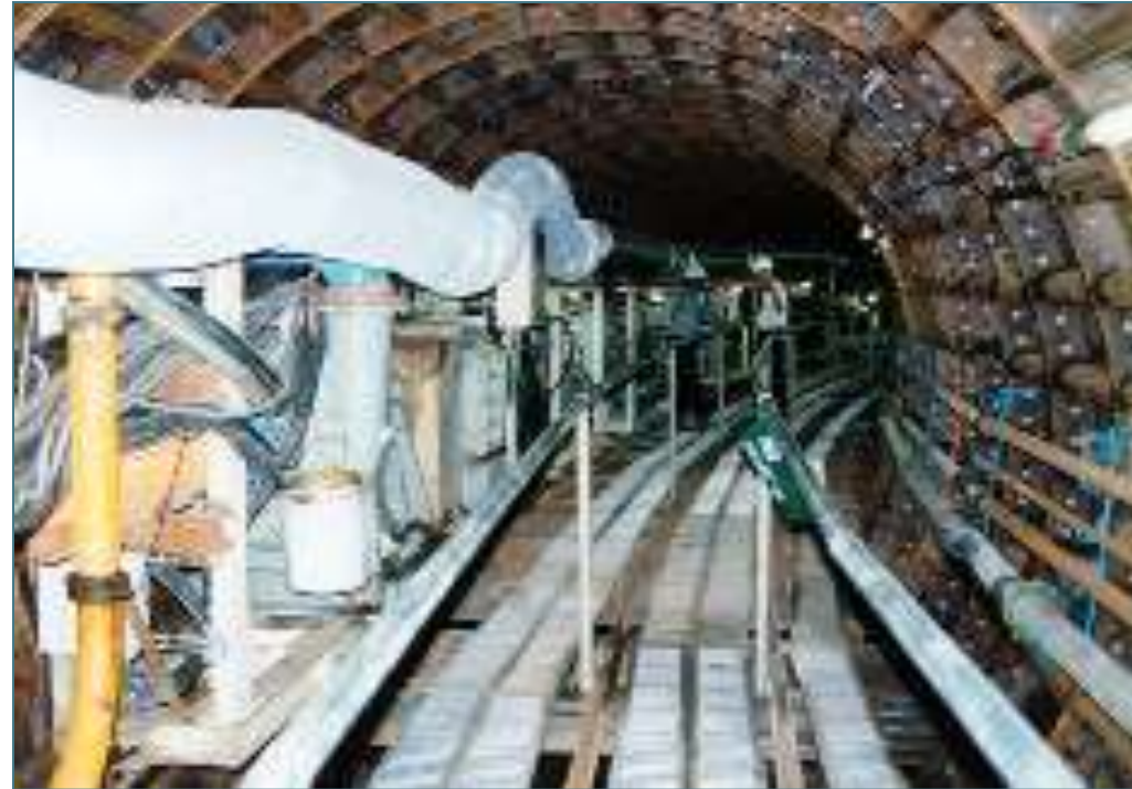
ちょっけい 直経 3m の下水道トンネル工事