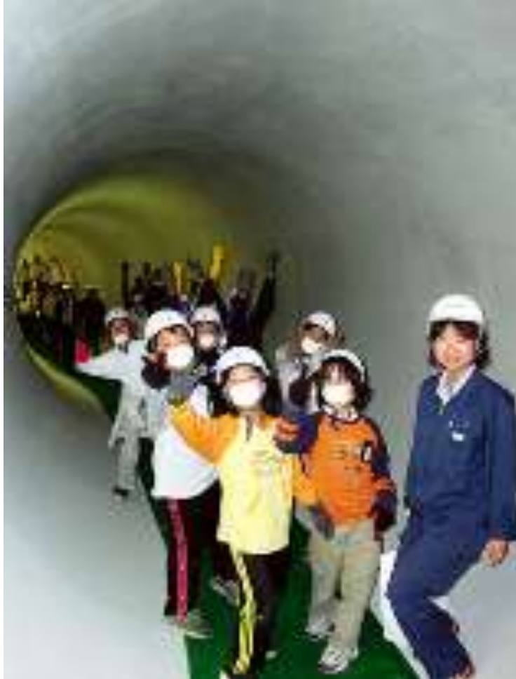
しもじ かんせん 下地 雨水幹線