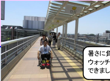
暑さに負けず、ウォッチングができました。