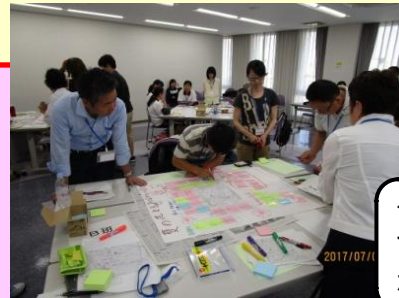
グループワークでは活発に意見が出ていました。