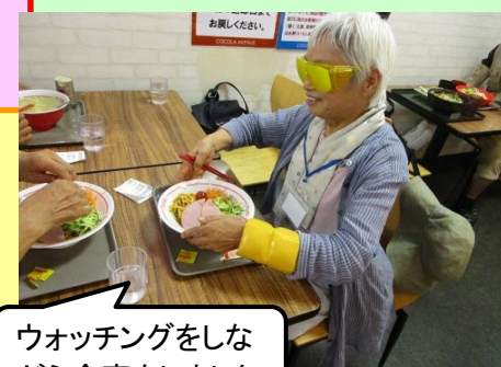
ウォッチングをしながら食事をしました。