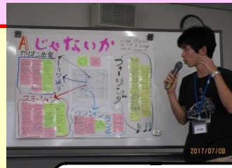
各班、趣向を凝らした発表をしていただきました。