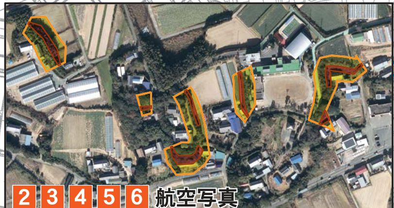
2 3 4 5 6 航空写真