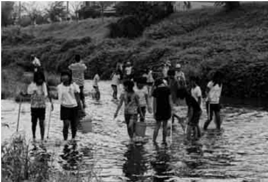
梅田川ふれあいクリーン作戦