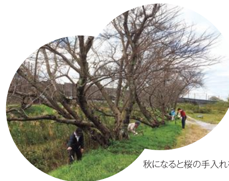
秋になると桜の手入れをします。

現在、「二川さくら守の会」では、桜の手入れを行うだけでなく、校区の方々に桜を楽しんでもらうためにイベントなどを開催しています。江戸時代は宿場として栄えていた二川校区。「桜を通じて、美しい景観を次世代につなぐ大切さを、校区全体でこれからも作り上げていきます。」と語ってくれました。