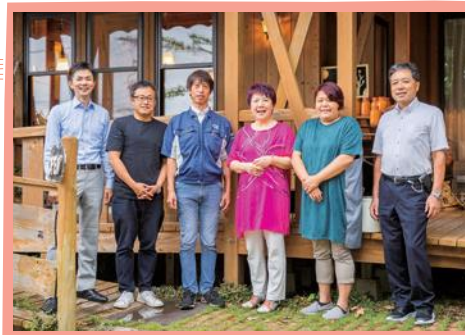
「二川さくら守の会」のメンバー