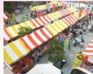
東三河観光物産展