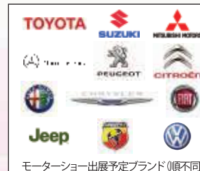
モーターショー出展予定ブランド(順不同) 三河港モーターショー