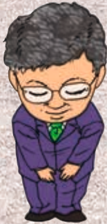
豊橋市長 佐原光一