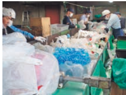
プラマークごみを選別するようす

この施設では、プラマークごみを選別しています。袋の中に、汚れたごみやペットボトル、プラマークがないプラスチック製品などが混ざっています。それらを施設の作業員が手作業で取り除いています。それらのごみが多いと、選別が難しくなるほか、きれいなプラマークごみまで汚れてしまい、リサイクルができなくなってしまう。