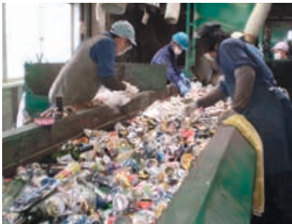
びん・カンを選別するようす

この施設では、びん・カンと、ペットボトルの選別をしています。ごみステーションには、中身が残ったままのびん・カンや、キャップやラベルが付いたままのペットボトルが多く出されているため、手作業での選別・除去が難しくなり、リサイクルができなくなってしまいます。みなさんのさらなるご協力が必要です。