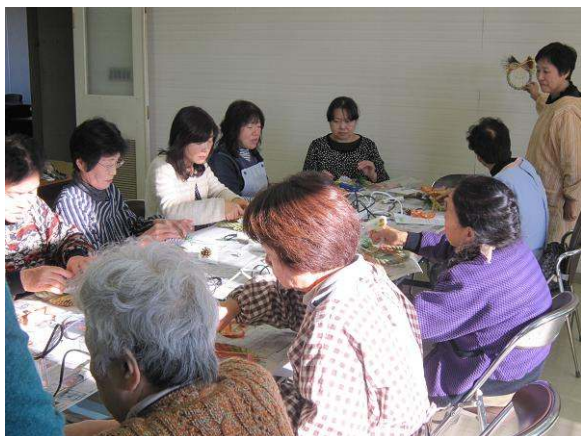
「しめ縄教室」の様子