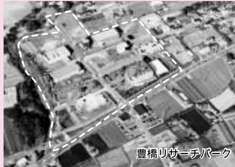
豊橋リサーチパーク

本市では、産業の振興および雇用機会の拡大を進めるため優良企業の誘致を積極的に行っています。今回、これまで以上にその促進を図るため、市内企業を支援する優遇策の新設も含め奨励制度全般にわたり拡充しました。