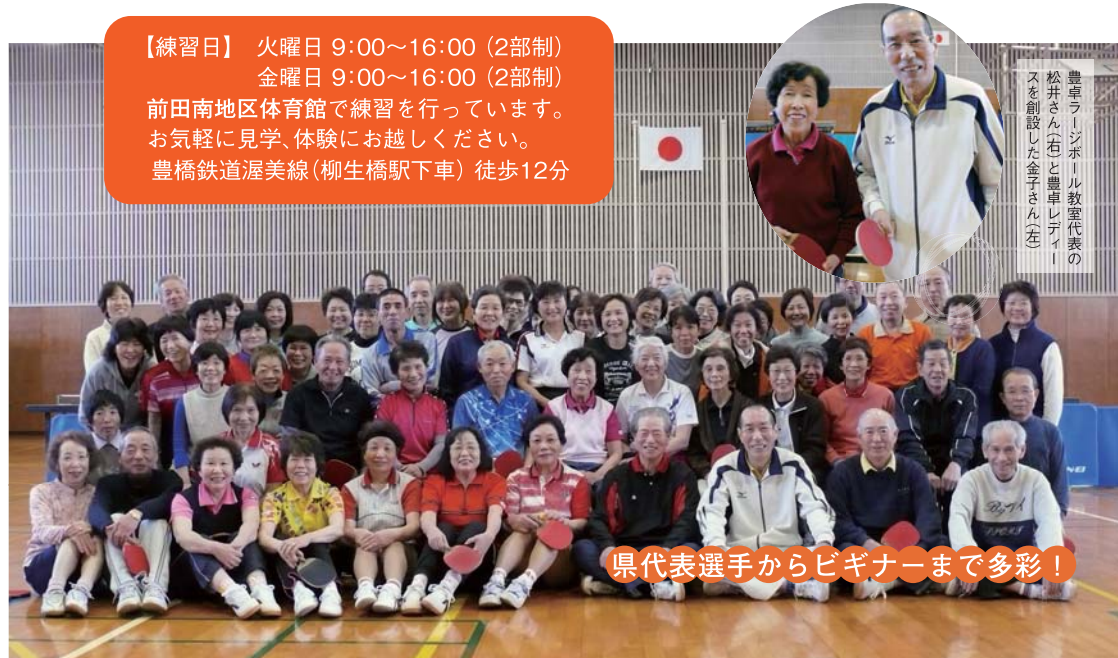
県代表選手からビギナーまで多彩！

【練習日】 火曜日 9:00~16:00 (2部制) 金曜日 9:00~16:00 (2部制) 前田南地区体育館で練習を行っています。 お気軽に見学、体験にお越しください。 豊橋鉄道渥美線(柳生橋駅下車) 徒歩12分