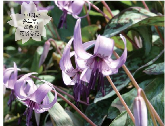
ユリ科の多年草。紫色の可憐な花。

■賀茂しょうぶ園 東三河では有数の花しょうぶ園。その種類は約300種3万7000株にもおよびます。花の咲く5月下旬から6月中旬頃に、花しょうぶまつりを開催します。期間中は、夜間ライトアップもあり、多くの観光客でにぎわいます。 ■カタクリ山のカタクリ カタクリ山では、3月下旬～4月にかけて、カタクリの花が満開となる自然豊かな山です。カタクリ山のすぐ近くの「郷道の滝の広場」も見どころです。 【交通案内】東名高速道路豊川インターより車で約10分。豊川駅より車で約20分。豊橋駅より車で約30分