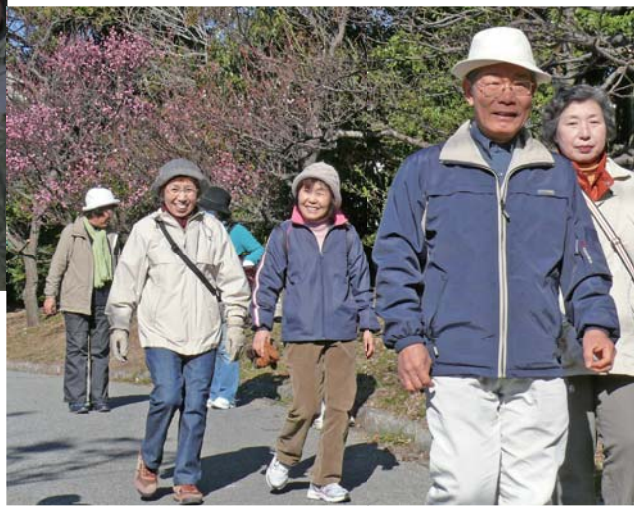
「じゃんだらりん」では、昨年、文化会館文化つじコース（12500歩）、三ツ口池（13000歩）、岩屋展望コース（6900歩）、高師緑地公園（9200歩）、正太寺と浜名湖西岸（7000歩）などを歩きました。