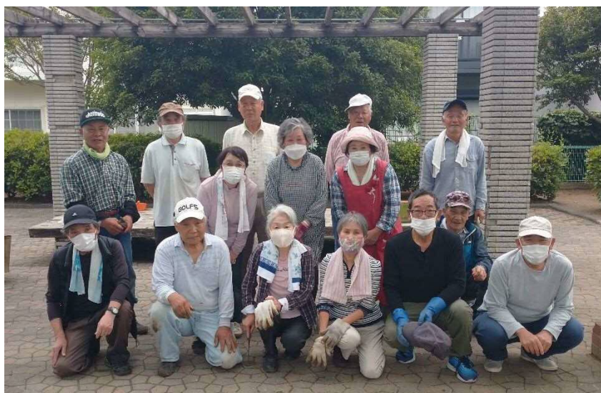
曙若松町自治会 の皆さん 若松中央公園（2,477 m 2 ） 豊橋市曙町字若松 81-2 他