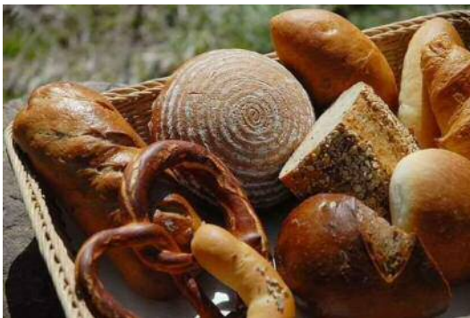
ベッケライミンデン/ドイツパン