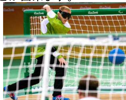
ユスタス・パジャラスカス 選手

※ユスタス選手の実績: 財2016得点ランキング3位、2017年世界選手権得点王