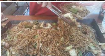
段戸山三河炭やき塾/ ジャンボフランク、焼きそば等