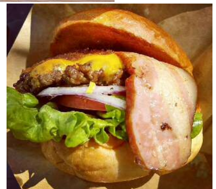
RAD LAND PICNIC/ハンバーガー