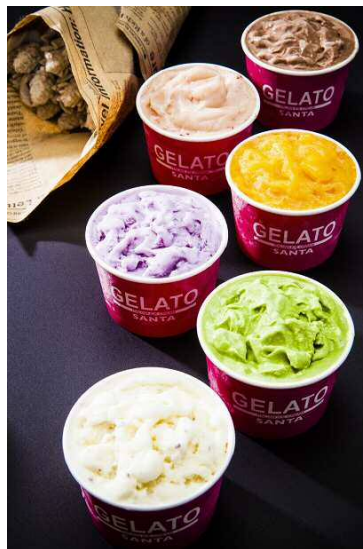
ジェラートサンタ/ ジェラート