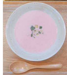
ごはん屋いっぽ/ リトアニア特産のピーツの 冷製スープ、 ランチ box ※ピンク色の珍しい スープです。