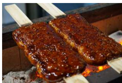
五平餅の天/五平餅