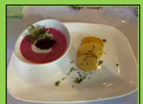
赤い!?ビーツのスープ

リトアニアは良質なリネンの生産地としても知られています。速乾吸収性に優れたうえ丈夫なリトアニアリネンを使った布製品は、日本でも人気を博しています。他にも、ビーツで作った赤いスープ「シャルティバルシチエイ」、ジャガイモの団子「ツェペリナイ」、ミートパイ「キビナイ」などおいしいものがたくさんあります。