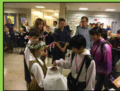
中学生交流の様子