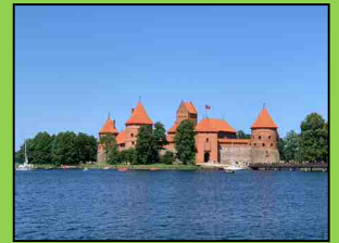
メルヘンなトラカイ城