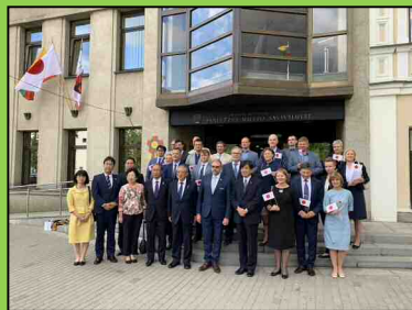
パネヴェジス市役所の前で

ライスヴェス広場（市の名まえの由来となるネヴェジス川の旧河川敷）、人形劇場、アートギャラリー、ガラス工房や CIDO アリーナ（スポーツ競技、イベント等に使用され、インナーサークルが設けられているのが特徴）など、多くの見どころがある。