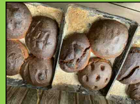
伝統的なライ麦パンのたね 焼きあがったライ麦パン