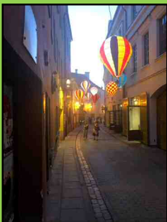
ヴィリニウス市街