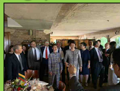
市民訪問団による歌の披露

2019 年 6 月には豊橋市からパネヴェジス市へ友好訪問団と市民訪問団を派遣しパートナーシティ協定を締結しました。今後も、相互互恵の原則に立ち、様々な交流を継続していきます。また、同年 10 月には早速、本市の中学生 23 名を派遣し、パネヴェジス市の中学生たちとの交流を行いました。こうした交流を通して、異文化に対する国際理解が進むことで、多様性を生かした地域の国際化を一層進めていきます。