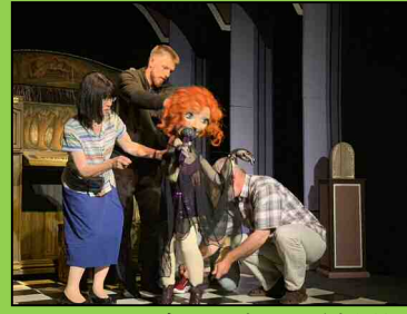
ノスタルジックな人形劇場