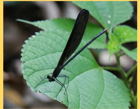
蛇穴の周辺にはいろいろな生き物がいた