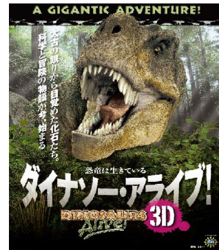
ダイナソー・アライブ！ 2K3D版 9/19～1/29