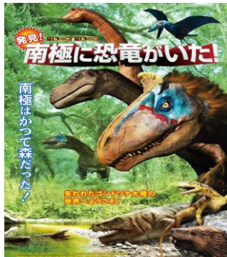
発見！南極に恐竜がいた！ 4K3D版、4K2D版 9/19～1/29

今回上映する番組は、「発見！南極に恐竜がいた！(4K3D版・4K2D版)」と「ダイナソー・アライブ(2K3D版)」の2作品で、「発見！南極に恐竜がいた！」は、日本初公開の最新番組です。