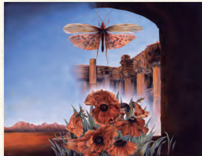
高木勲「遺された風景」1981年