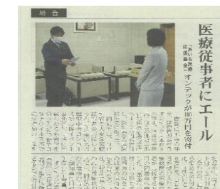
④医療従事者の方を応援するために「あいち医療応援基金」に寄付

新型コロナウイルス感染症の影響で逼迫している医療従事者に感謝の気持ちとして「あいち医療応援基金」に寄付いたしました。