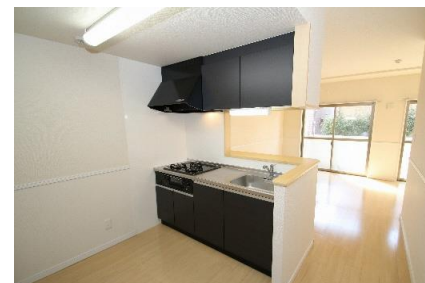
①健康な生活を確保するために分け隔てなく生活を送れるお部屋の提供

またオンテックでは、「住まいて、人生だと思おう」をテーマに「地域社会」・「環境」・「人」について目指す姿を示し、SDGsの各目標と連動した活動を推進しています。さらに、経営戦略とSDGsへの取り組みの統合を図るべく、「第45期オンテック経営計画」において、SDGsを経営戦略の枠組みに取入れ、当社もSDGsの目標に向けた活動を積極的に推進してまいります。