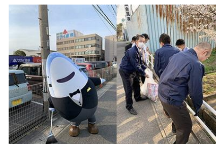
③地域の清掃を行うことで住み続けられるまちづくりに貢献