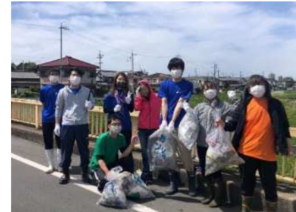
朝倉川育成フォーラム清掃活動

フジプレコン株式会社は、1982年に創業し、コンクリート二次製品の製造販売事業を行っている【コンクリートのプロ集団】です。 愛知県内の工場で製造された「鉄道」や「道路」工事におけるコンクリート製品を北は北海道から南は九州まで提供しています。 フジプレコンの製品は、安心・安全な暮らしを支える基盤であり私達の生活の身近な場所でとても大きく関わっています。 感謝・貢献を社是とし、お客様の期待以上のサービスを提供する、そしてフジプレコンに関わる全ての人々が幸せになってもらえるよう社員一同日々努力を続けてまいります。目まぐるしく変化していく環境の中で、持続可能な社会と、発展のためにどこまでもお客様に寄り添いながら歩んでいきます。