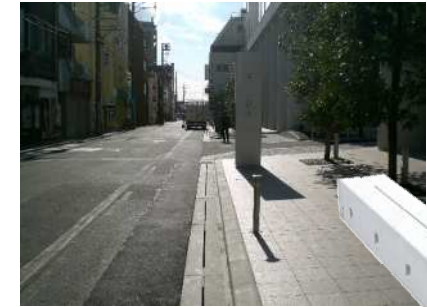
防災、減災対策製品の開発