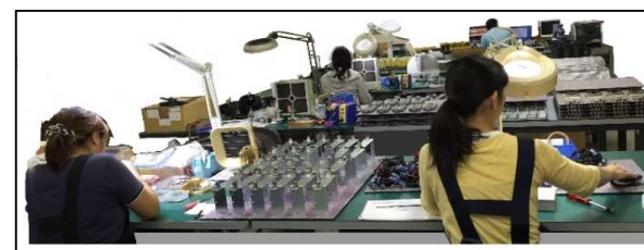
多くの女性従業員が活躍