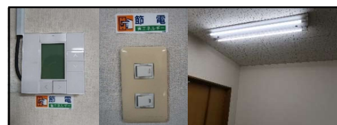
節電シールやLED照明で電力削減

不要となった未使用の部品等を廃棄せず、ECサイトを使い販売、有効活用してもらう。 【ゴール12,13】