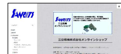
ECサイトを活用し、不要在庫販売