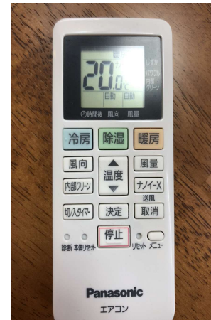
暖房は環境省推奨の20度

株式会社Liberesは、マンガ情報サイト「コミタス」、メンズ脱毛総合サイト「ツルオ」、Web広告事業を運営している会社です。 弊社では、子育てや介護などの理由で都内へ出社できない社員に対し、在宅を推奨しています。時間と場所を問わず仕事ができ、自由なライフスタイルをに実現してもらいたい強い思いがあります。弊社のWEBのノウハウを活用し、SDGsの達成に向けて進んでいきます。