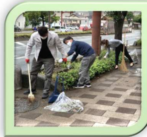
↑毎月行っている市内清掃活動

全従業員が一体となり、「誠実に、そして正確・迅速・丁寧に」をモットーに、地域社会とお客様から頼りにされる企業を目指しております！