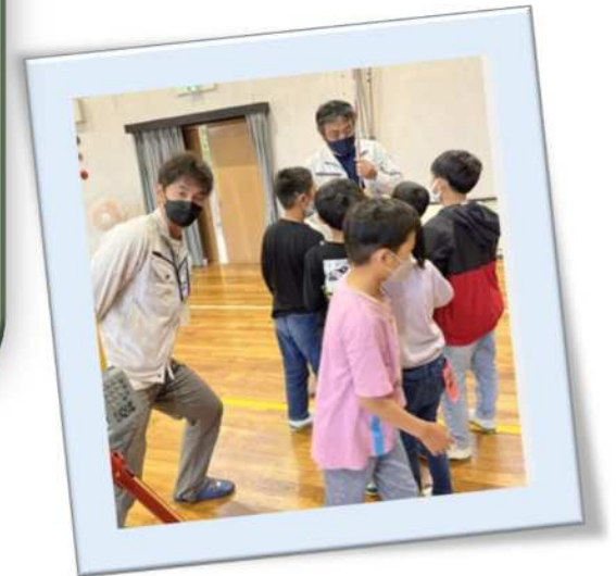
↓小学校での出張測量教室