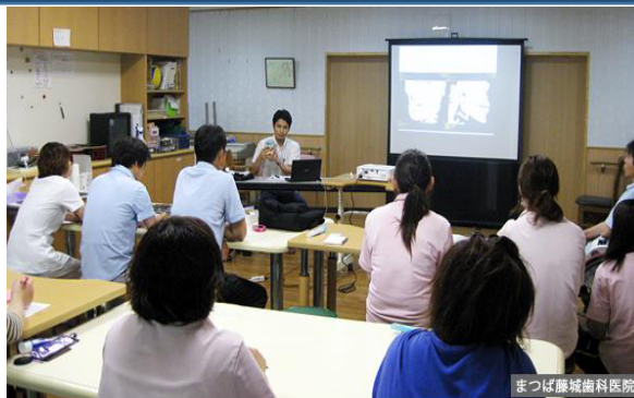
2015年 障害者支援施設職員研修 障害者に対する基本的な口腔ケア

外来診療・往診・有病者歯科・口腔ケア・摂食嚥下リハビリの経験をもとに、高齢者や介護家族・スタッフさん向けに様々な講演活動・指導を承っております。ご希望の方は、お気軽にお電話にてお問い合わせください。講演時間や内容はご相談の上決めさせていただきます。