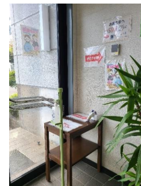
感染症対策の実施