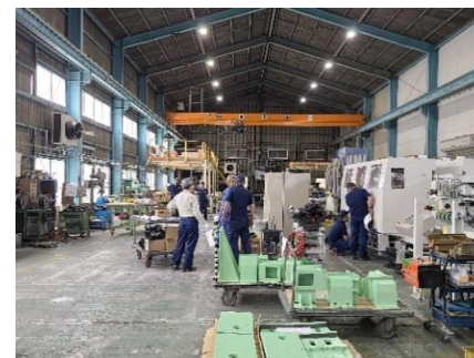
工場内空調 熱中症予防