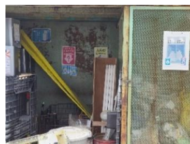
←ごみの分別 エコキャップ→