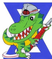
豊橋市消防本部 マスコットキャラクター 「ヒケッシー」