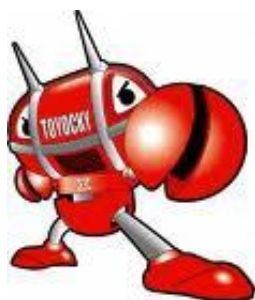
豊橋市マスコットキャラクター 「トヨッキー」