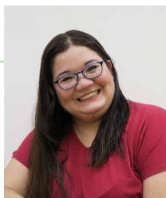
タクシー会社勤務 ブラジル国籍 20代女性

A. もともと運転が好きで、人と話すのも好きでした。そんな時、この事業のチラシを見て、「これだ!」と思い、参加しました。