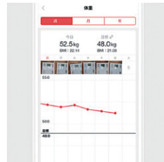
仲間と励まし合うことで 楽しく習慣化できる!