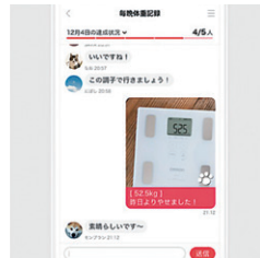
チャットでチャレンジの 写真とデータを送り合おう!