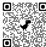
ぽけとよ WEB ページ