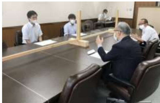
▲市長と令和2年度わかば議会議員との意見交換の様子