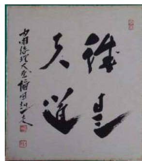
福田赳夫総理色紙