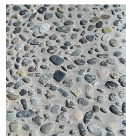
写真左：整備後 中：整備前 右：床面の洗い出し仕上げ

二川宿まちなか公園の西側の角地で、格子状の柵の整備と住宅の塗装を実施。こげ茶の木製格子柵とともに、小石を混ぜた床面の洗い出し仕上げで、建物解体によるまち並みの繋がりの喪失感が和らげられています。住宅の塗装は、二川宿の伝統的な家屋の特徴に合わせて色が塗り分けされています。敷地の前は、二川八幡社の例祭で、3台の山車が集まる場所。祭り夜に、どんな背景に見えるか楽しみです。