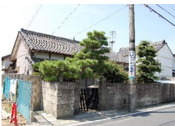
写真上：整備後 下：整備前

旧街道沿いに建つ伝統的な形態の家屋が改修され、新しい店舗に生まれ変わりました。旧街道に向かって屋根が傾斜する切妻平入りの伝統的な外観を継承しながら、軒下には繊細な木製の格子を設け、宿場町らしい魅力が創出されています。また、敷地内の蔵を残すとともに、小屋根を設けた看板の設置や、小石を混ぜた駐車場の仕上げなど、二川宿の歴史を大切にしたいというお施主さまの思いが沢山表れています。