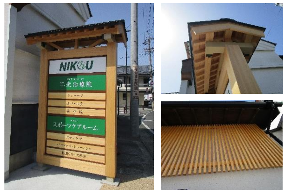
写真左上・右上：小屋根付きの看板 右下：軒下の木製格子