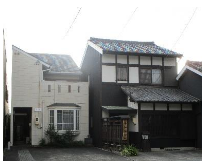
写真左：整備前 右：整備後

整備後は、まち並みにとけ込む外観となり、駒屋周辺の落ち着きが一層向上しました。また、駒屋横の瀬古道を歩くと正面に見える建物ですが、瀬古道の趣ある雰囲気により増しました。