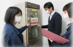
毒物・劇物の監視指導