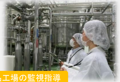
食品工場の監視指導