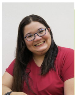
Taxi Company Job Babae, edad ng 30's, Brazilian Nationality

Hilig ko kahit dati pa ang pagmamaneho at mahilig akong makipag-usap sa Tao. Noong nakita ko ang Pamphlet tungkol sa trabaho ng Driver, nasabi ko sa sarili ko na, 「Ito na ang hinahanap ko!」 kaya ako nagpunta dito.