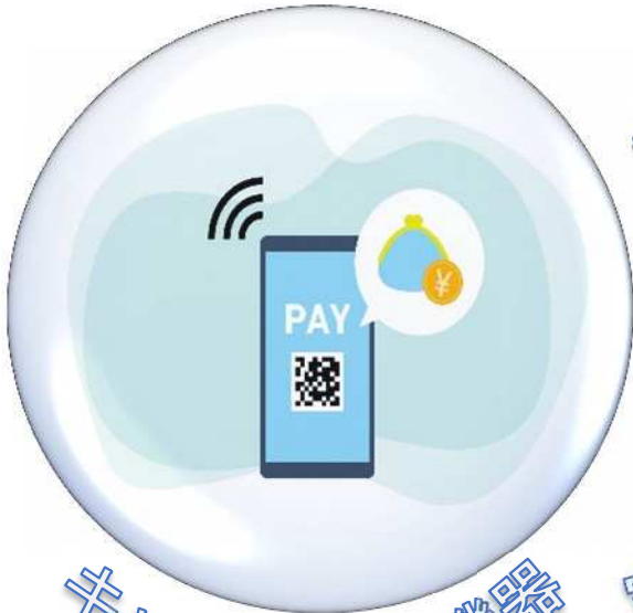
キャッシュレス機器