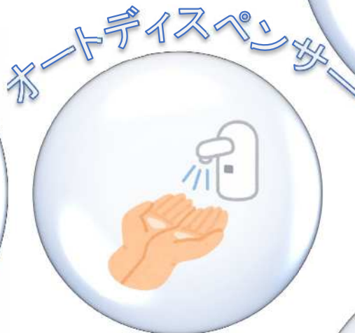
オートディスペンサー