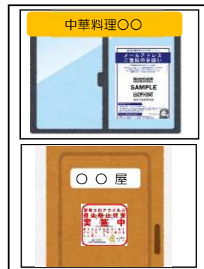
⑦⑧の提出例（貼付用フォーマットあり）

※ステッカー・ポスターと店舗名のわかる看板等と一緒に写真を撮影してください。（看板等が映っていない場合、ポスターに記載の店舗名がわかる写真も可）