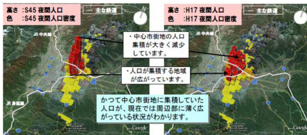
都市構造の可視化(人口集積の比較)