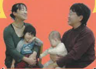
ビジターさんとアレコレおしゃべり

ゆっくりと話を聞いてもらえて心が軽くなり、 穏やかな気持ちで子どもと接するようになりました。 私にも子どもにもよいキッカケになりました。