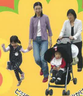
ビジターさんと一緒にお出かけ