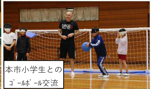
本市小学生との ゴールボール交流