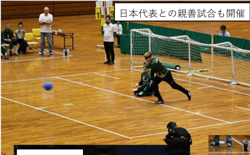
日本代表との親善試合も開催