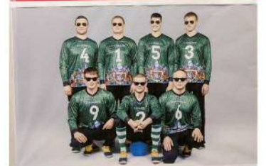
東京2020パラリンピック競技大会 出場内定告知ポスター