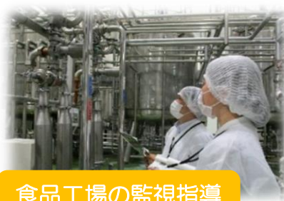
食品工場の監視指導