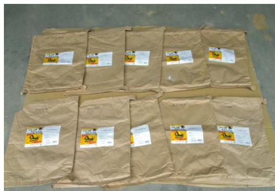
図2：散布したすべての薬剤の空袋数がわかる写真