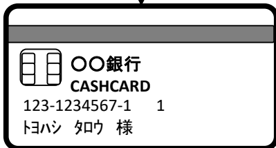
キャッシュカード