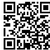
QRコード（ほっとメール）

利用登録時に使用したメールアドレスを、のびるん de スクール配信メール用に使用します。この配信メールは、緊急時等の連絡に使用します。 のびるん de スクール予定表にも利用します。