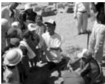
アカウミガメ産卵巣の説明のようす

▶ とき 7月28日(土) 8月4日(土) 8月8日(水)時間は 午前4時～6時。 午前8時30分～10時▶ ところ 表浜海岸(参加者に案内図送付)▶ 対象 小学生以上(小・中学生は保護者同伴)▶ 内容 表浜海岸を歩きながら、一日調査員としてアカウミガメの上陸・産卵調査を体験します。 表浜の海浜植物などの観察とアカウミガメの産卵巣調査▶ 定員 各50人(申込順)▶ 参加料 無料▶ 持ち物 タオル、帽子、飲み物、筆記用具、砂浜を歩ける服装▶ 申し込み 7月20日までに希望日、参加者全員の氏名・郵便番号・住所・電話番号・年齢を環境保全課(〒440-8501住所不要 ☎51・2385 ☎56・5126 国 kankyohozen@city.toyohashi.lg.jp)