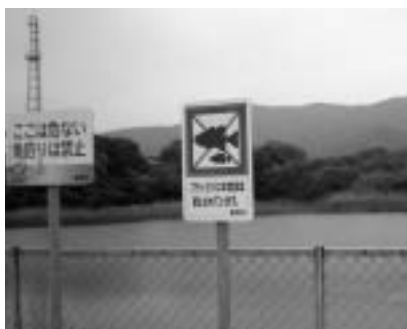
ため池に設置された看板と防護柵