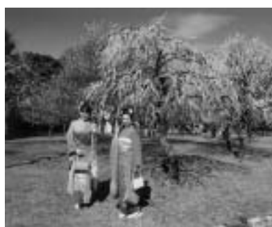
藤田正男 / 「梅林の仲よし姫」

推薦 藤田正男(浜松市) 特選1席 天野修(高浜市) 特選2席 仲根英之(山田一番町) 準特選 宮地英敏(浜名郡新居町)、今田弘(浜松市)、小野田博志(杉山町) 問合せ先 商業観光課(☎51・2430)