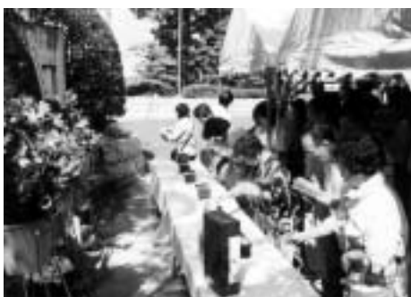
動物慰霊祭のようす