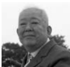
こしばまさとし 豊橋市生まれ。宇宙線実験や、電子・陽電子衝突型加速器を用いた実験を行い、素粒子物理学において、常に世界の最先端を歩み続けてきた。2002年には、天体物理学、特に宇宙ニュートリノの検出における先駆的な貢献によりノーベル物理学賞を受賞。2003年豊橋市民栄誉賞受賞。