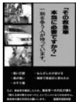
適正利用ポスター

ジャスコ豊橋南店のリサイクルステーションの場所が変わります 増築工事に伴い、北側駐車場のガソリンスタンド隣に仮移設していましたが、9月1日から増築部分裏側の屋上スロープ下（仮移設前の場所）に戻ります。 問合せ先 環境政策課（☎51・2399）